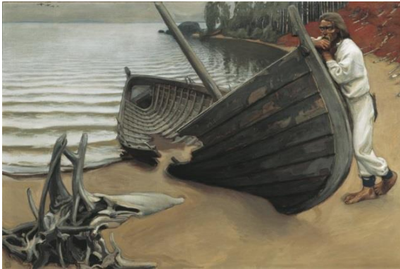
Akseli Gallen-Kallela, Purren valitus (1907)

Taidesäätiö Merita sr on yleishyödyllinen säätiö, jonka tarkoituksena on toimia suomalaisen taiteen ja taidehistorian tutkimuksen hyväksi. Säätiö ylläpitää ja kehittää omistamaansa taidekokoelmaa, joka sisältää lukuisia kansallisesti tunnettuja teoksia ja taidehistoriallisia harvinaisuuksia. Lähes kaikki säätiön kokoelman teokset on poimittu Nordean suomalaisen edeltäjäpankin, Merita Pankin, kokoelmasta. Sen juuret ovat 25 suomalaisen liikepankin, etenkin Kansallis-Osake-Pankin ja Suomen Yhdyspankin yli sadan vuoden aikana keräämissä kokoelmissa.