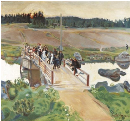
Antti Favén, Juhannustanssit (1911)

Aleksanterinkatu 36B:n Pankkisali ja Lounashuone toimivat myös Taidesäätiö Meritan näyttelytilana. Esillä on Taidesäätiö Merita sr:n kokoelman Suomen taiteen kultakauden, mm. Albert Edelfeltin, Akseli Gallen-Kallelan, Pekka Halosen, Berndt Lindholmin, Fanny Churbergin ja Ferdinand von Wrightin maalauksia. Teoksiin on mahdollista tutustua taidehistorian asiantuntijoiden vetämillä opastetuilla kiertokäynneillä, joita järjestetään ryhmille tilauksesta.